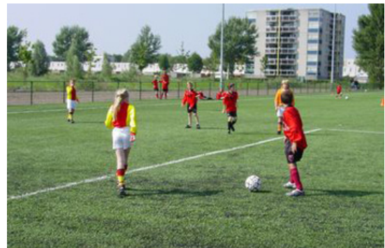
Sportpark Delft-Zuid beslaat de volle breedte van het zoekgebied

In een artikel in de Volkskrant van 28 februari maakt de Fietsersbond bekend wat de gevaren zijn van ultrafijn stof voor de volksgezondheid. In een reactie zegt de toxicoloog Flemming Cassee van het Rijks Instituut voor de Volksgezondheid (RIVM) dat ultrafijn stof schadelijker is dan gewoon fijn stof. "Waarschijnlijk omdat de kleinere deeltjes gemakkelijker dieper in de longen kunnen doordringen." Het RIVM is het rijksinstituut dat eerder een geruststellend advies uitbracht over de relatie tussen ultrafijn stof en elektromagnetische velden van de 380 kV hoogspanningsmasten, die ten zuiden en westen van het Tanthof dreigen te worden geplaatst.